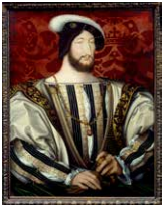
Portrait de François I er Jean Clouet (1480-1541).

OBJECTIF Comprendre comment le roi se met en scène pour affirmer son pouvoir.