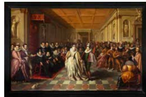
BAL DE NOCES À LA COUR DU ROI (1581).