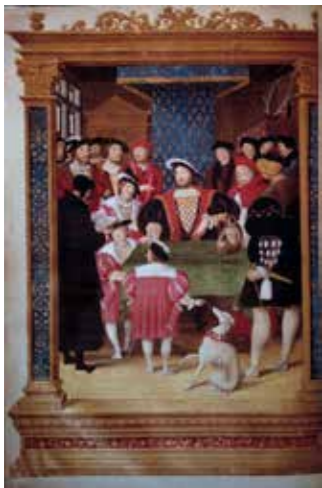
LE ROI ET SA COUR Miniature de Jean Clouet, 1534.

OBJECTIF Découvrir les moyens utilisés par François I er pour renforcer son autorité.