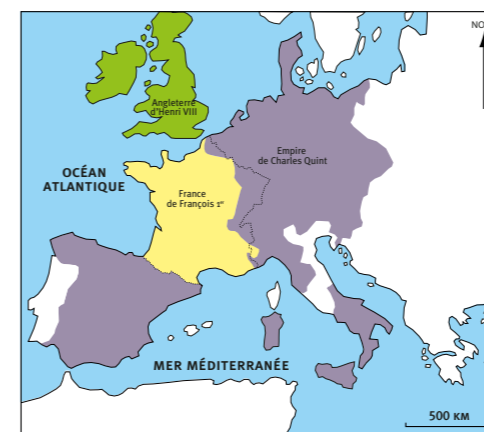
LES TROIS PUISSANCES EUROPÉENNES AU DÉBUT DU XVI e SIÈCLE

OBJECTIF Montrer qu'avec le roi François 1 er , la France fait partie des trois grandes puissances européennes.