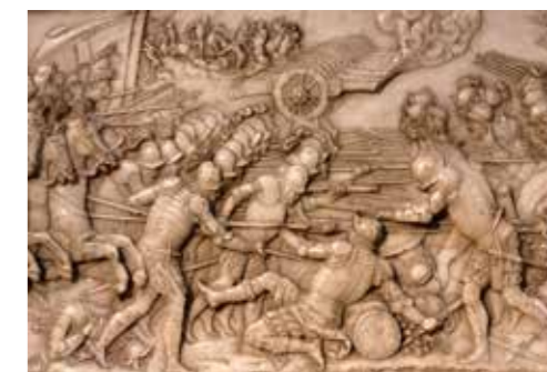
LA BATAILLE DE MARIIGNAN, 1515.