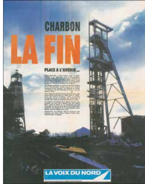
La Voix du Nord. 22 décembre 1990