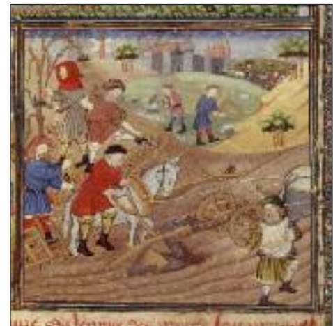
LE TRAVAIL DE LA TERRE Miniature extraite de "Le régime des Princes" Gilles de Rome, 1450.