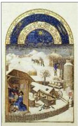
LE MOIS DE FÉVRIER : LA NEIGE Enluminure de « Les Très riches Heures du duc de Berry » de Pol de Limbourg. XV e siècle.

OBJECTIF Comprendre le cadre de vie des paysans du Moyen Âge.