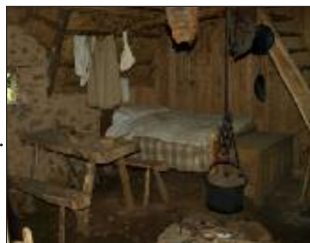
INTÉRIEUR D'UNE FERME MÉDIÉVALE Archéologie expérimentale, Saint Julien au Bois.

Similitudes : habitat en bois, sol en terre battue, pièce unique pour cuisiner, manger, dormir. Différences : hauteurs de plafond, absence de grenier /escalier menant au grenier, cheminée avec conduit d'évacuation au toit / foyer entouré de pierres au sol avec évacuation des fumées par le grenier, poutres rectilignes /trunks équarris, robe bleu vif/étouffe grossière des draps.