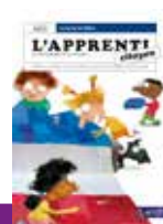
CM1 - CM2 - 6 e