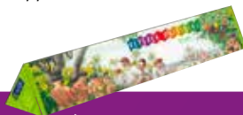
8 à 12 ans