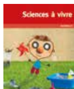
PS - MS - GS