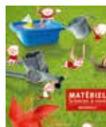
PS - MS - GS