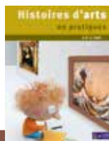
6 à 12 ans