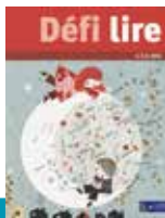
CP - CE1 - CE2