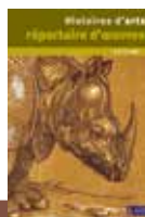
6 à 12 ans