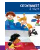
CM1 - CM2 - 6 e