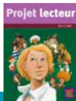
CM1 - CM2